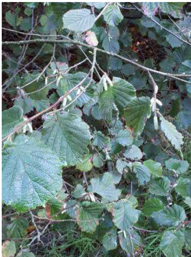
Bij de Zwarte Els groeiden in september al nieuwe elzenkatjes.

“Vrienden van het Waterwingebied” Reijmerinkstraat 34, MH Amersfoort KvK nr. 32085084 Bank: ABN-AMRO rek. NL78 ABNA 054.92.35.175”