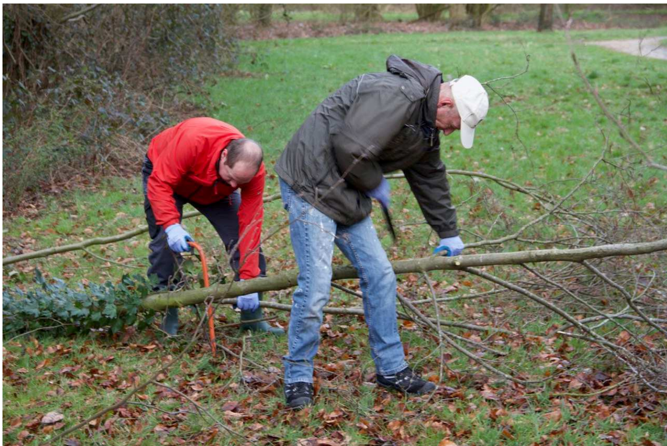
Vrijwilligers behulpzaam bij knotten bomen.

“Vrienden van het Waterwingebied” Reijmerinkstraat 34, MH Amersfoort KvK nr. 32085084 Bank: ABN-AMRO rek. NL78 ABNA 054.92.35.175”