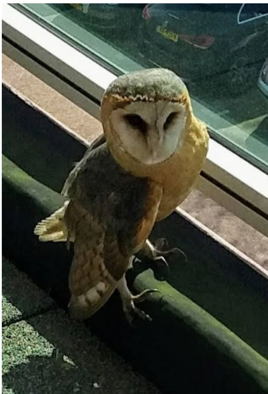
Kerkuil op balkon flat Vogelweide.